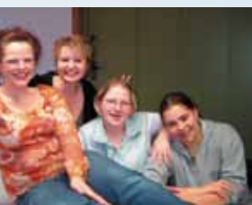
Freude am Lernen