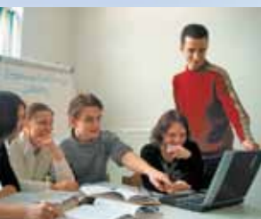
kritisch-konstruktivem Denken ...