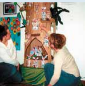
kreativem Handeln ...