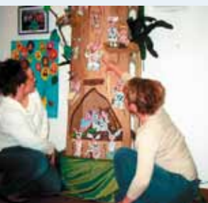
kreativem Handeln ...