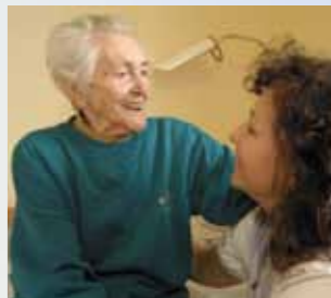
ältere Menschen ...