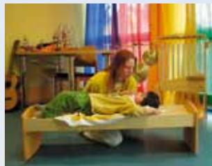
behinderte/kranke Menschen ...