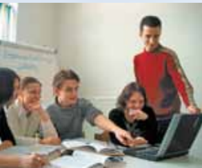
kritisch-konstruktivem Denken ...