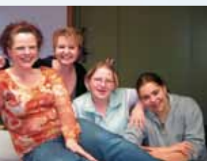
Freude am Lernen