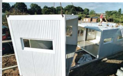
SCHULE UND KINDERGARTEN