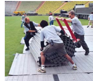
BAUSTRASSEN UND BODENBELAGSSYSTEME