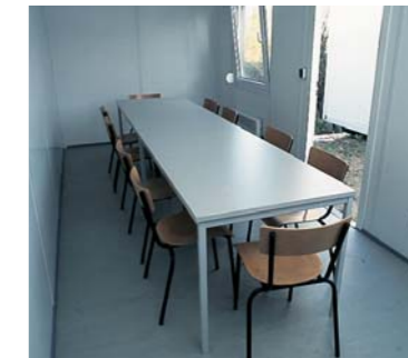
MOBILAR UND INNENAUSSTATTUNG