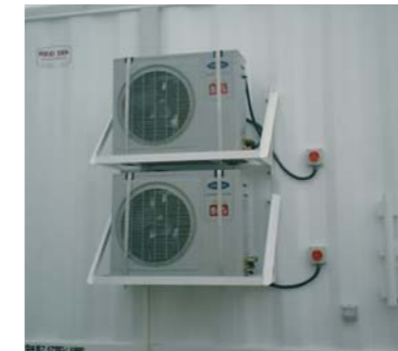
KLIMA UND STROM