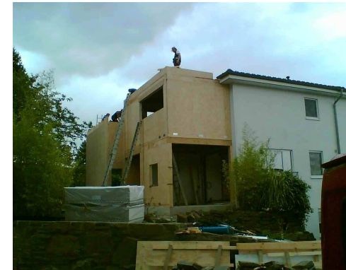
Bergisch-Gladbach, Anbau 80 m 2 Bausatz brutto 16.000 EURO