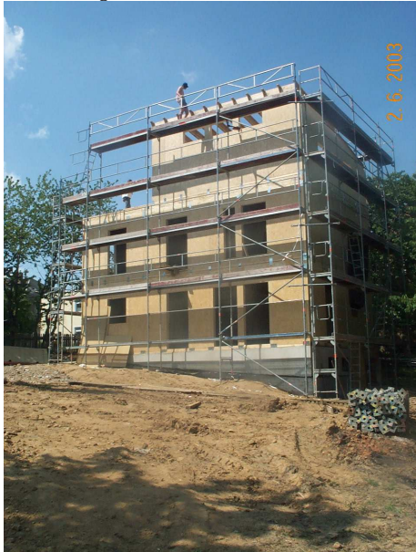
Mittweida Poststraße, ca. 150 m 2 Bausatz brutto ca. 38.000 EURO

Preisangaben 2006 inkl. 16% Mehrwertsteuer