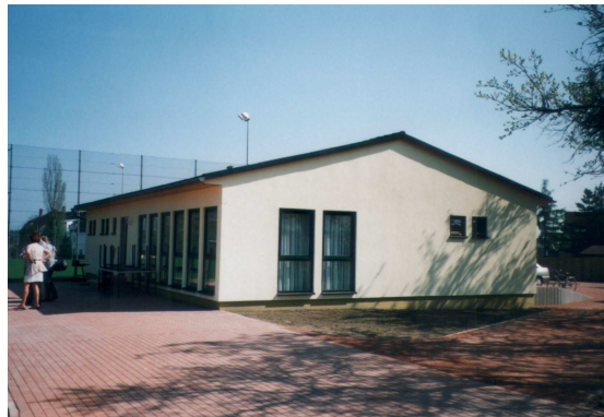
Altmittweida, 160 m 2 , Bausatz brutto ca. 30.000 EURO, TC Grün-Weiß e.V.