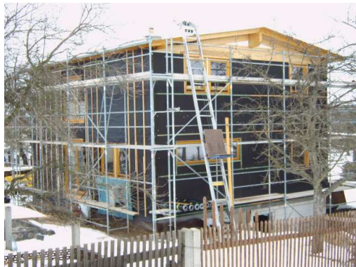
Gera, ca. 180 m 2 Bausatz brutto ca. 39.000 EURO