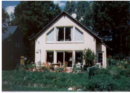
Erlau-Crossen, 160 m 2 Bausatz brutto 42.000 EURO Mit 2 Gauben und Erker