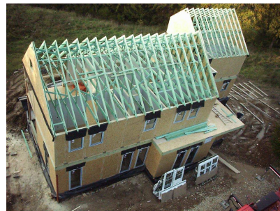
Belgien 400 m 2 Bausatz ca. 85.000 €