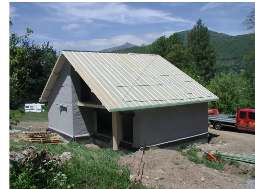
Frankreich, ca. 150 m 2 Bausatz brutto 34.000 EURO