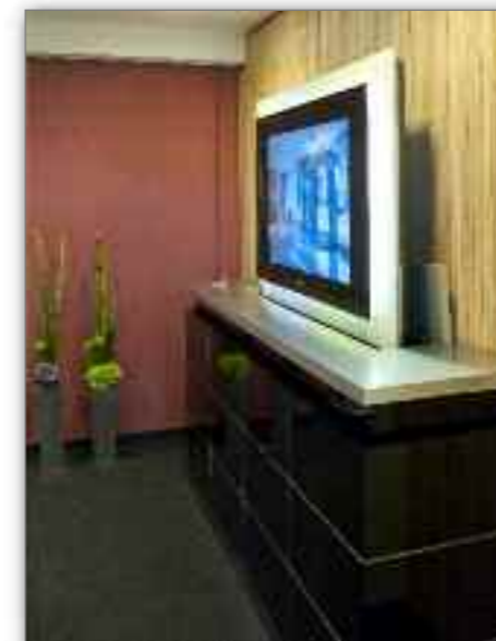
Medienmöbel mit automatisch versenkbarem LCD Monitor Medienraum mit verschiedenen Akustikelementen,

Multimediaräume mit individuellen HighTech-Lösungen. Musterbüros mit Akustiklösungen lassen Raumakustik spürbar erleben und Konzepte für Gastronomie und Innenausbau erwarten den Besucher. Die Goldbach Kirchner Welt bietet mit Designstudien und visionären Raumconcepten den Ideenpool für Architekten, Planern sowie Bauherren. Sie soll gleichermaßen informieren und inspirieren. In Kooperation mit Partnern und Planern haben wir ein Branchenforum installiert, das allen Besuchern und Interessierten gleichermaßen offensteht und sich als Plattform für Trends, Designs und technische Entwicklung versteht. Es dient dem Gedankenaustausch sowie der Entwicklung neuer Ideen und Visionen.