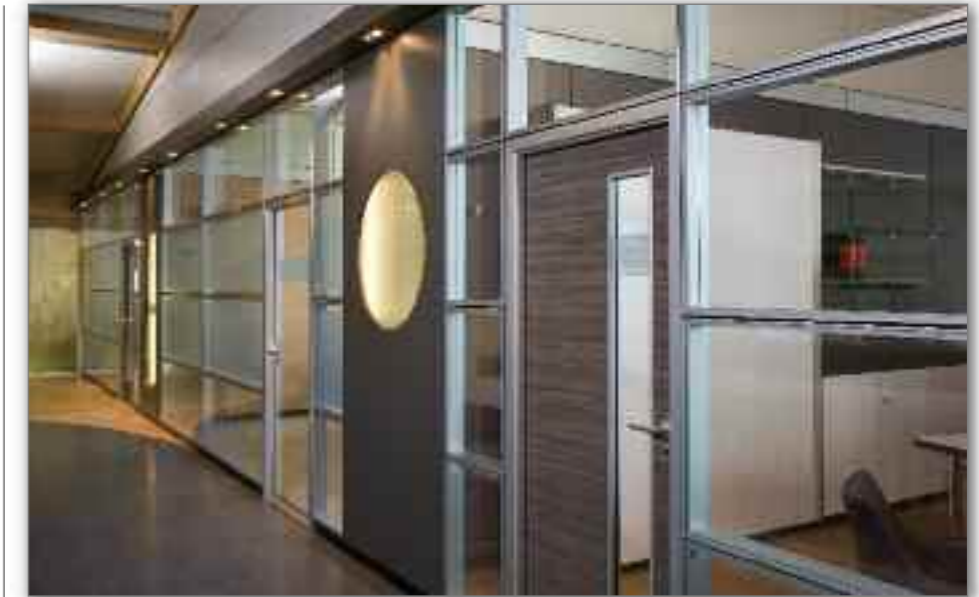
Trennwandsysteme mit horizontaler Unterteilung. Gezeigt werden Glasvarianten, technische Gläser sowie Folien- und Lasertechniken. Trennwandsysteme mit horizontale Unterteilung. Gezeigt werden Glasvarianten, technische Gläser sowie Folien- und Lasertechniken.