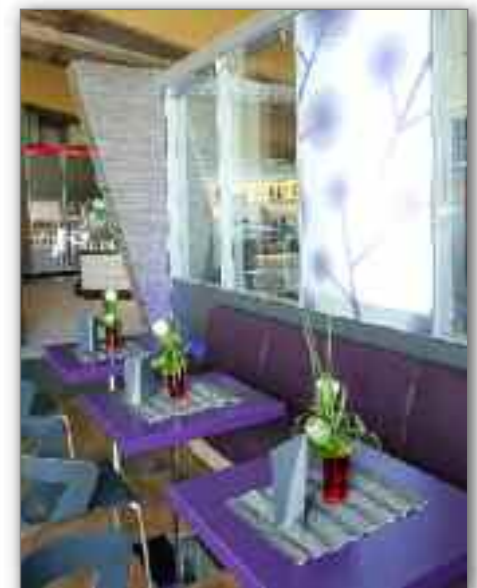
Gastroeinrichtung vor Glastrennwand mit Eurolamex-Glas, Motiv: Blowball. Medienraum mit verschiedenen Akustikelementen,