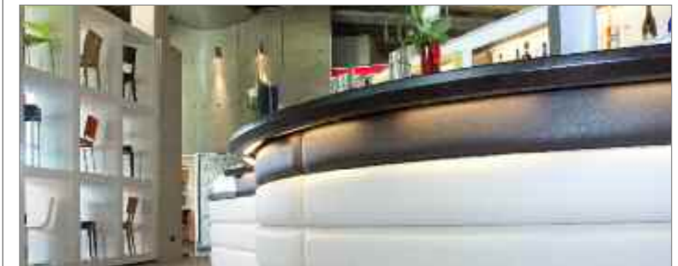
Der Gastrobereich mit Theke und Sitzmöbeln vermittelt aktuelle Trends. Der Gastrobereich mit Theke und Sitzmöbeln vermittelt aktuelle Trends.

Multimediaräume mit individuellen HighTech-Lösungen. Musterbüros mit Akustiklösungen lassen Raumakustik spürbar erleben und Konzepte für Gastronomie und Innenausbau erwarten den Besucher. Die Goldbach Kirchner Welt bietet mit Designstudien und visionären Raumconcepten den Ideenpool für Architekten, Planern sowie Bauherren. Sie soll gleichermaßen informieren und inspirieren. In Kooperation mit Partnern und Planern haben wir ein Branchenforum installiert, das allen Besuchern und Interessierten gleichermaßen offensteht und sich als Plattform für Trends, Designs und technische Entwicklung versteht. Es dient dem Gedankenaustausch sowie der Entwicklung neuer Ideen und Visionen.