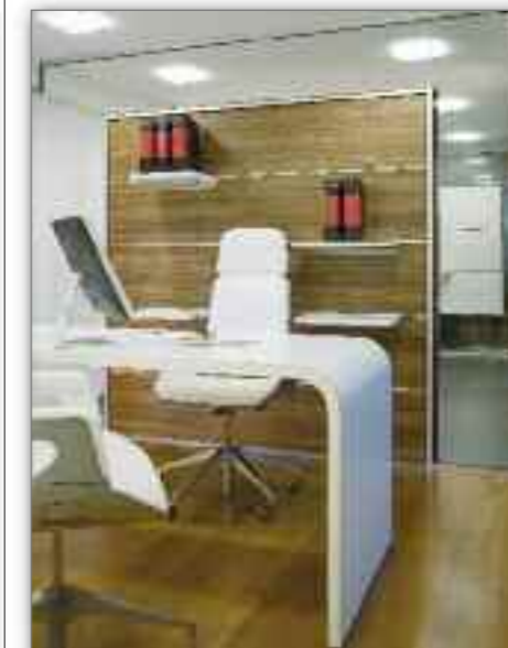
Raumconcepte mit Ganzglas- und Vollwandelementen, horizontal organisierbar Medienraum mit verschiedenen Akustikelementen,